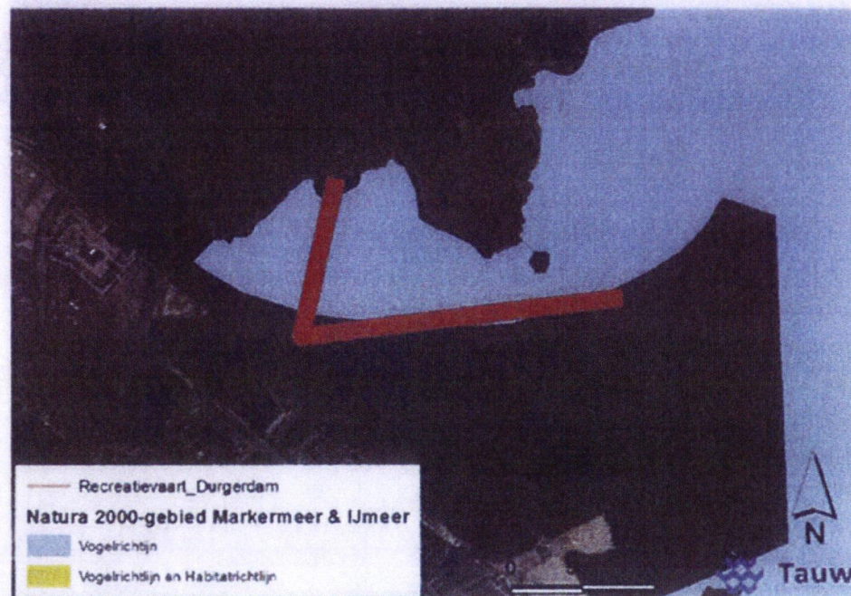
Figuur 6.21 Recreatievaart maailocatie Durgerdam

De maailocatie ten behoeve van recreatievaart nabij Durgerdam is gelegen in Vogelrichtlijngebied (figuur 6.21).