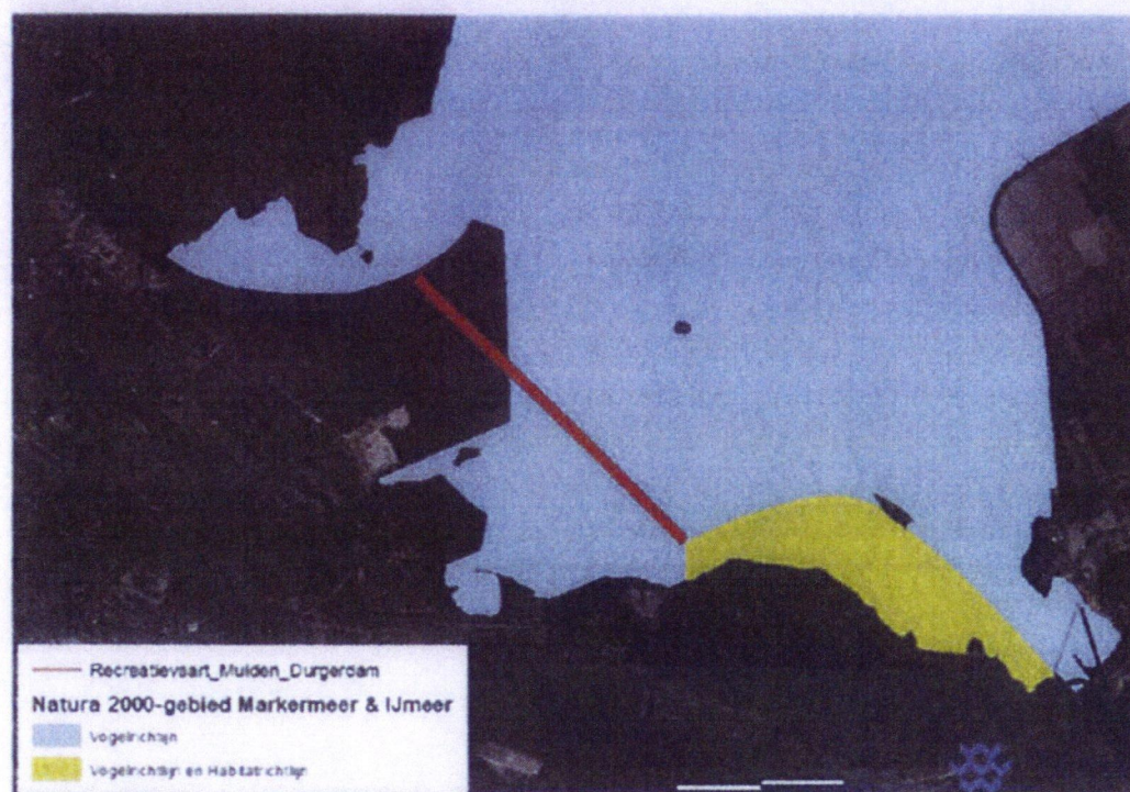
Figuur 6.20 Recreatievaart maailocatie Muiden – Durgerdam

De maailocatie ten behoeve van recreatievaart als verbinding van Muiden naar Durgerdam is gedeeltelijk gelegen in Vogelrichtlijngebied (figuur 6.20).